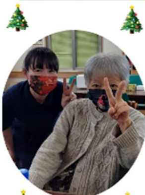
今年もこの季節になりました～