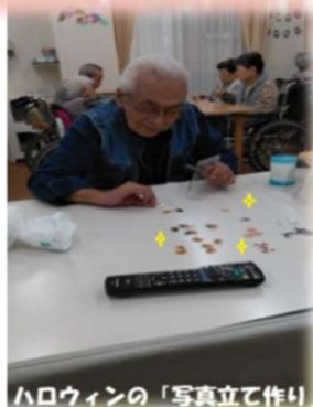
ハロウィンの「写真立て作り」