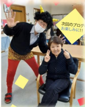
次回のブログ お楽しみに！！