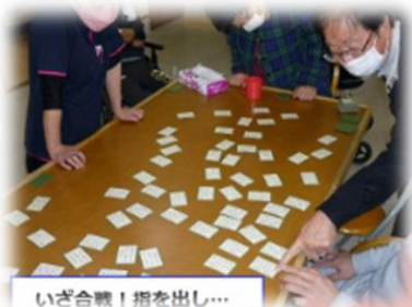
いざ合戦！指を出し…