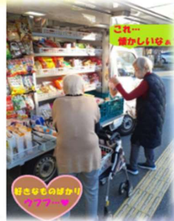
好きなものばかり カラフル〜♪