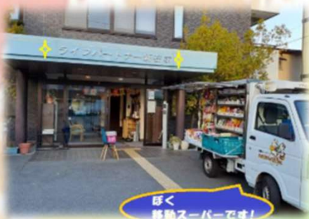
びく 移動スーパーです!