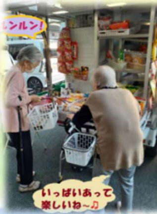
いっぱいあって 楽しいね〜♪